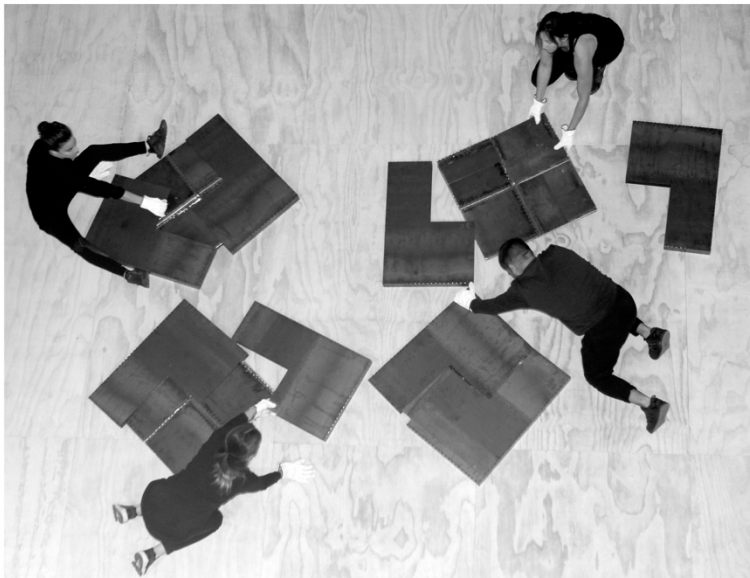
Performance Dignidad, Archivo Nacional de Chile, Stgo. 2018