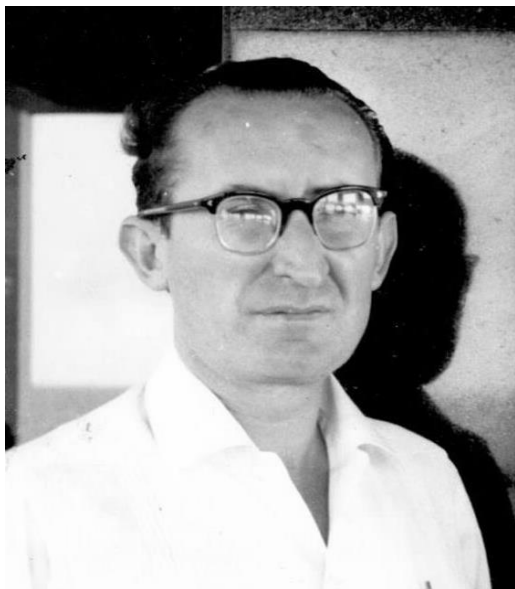
Luis de la Puente Uceda