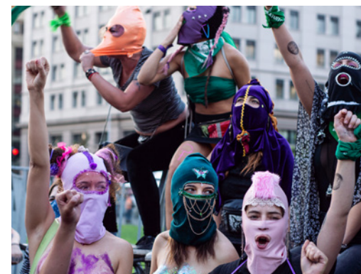
8 de marzo 2019 - Santiago, Chile.

Hace algunos años, en conmemoración de esta larga historia, y en medio de las movilizaciones feministas mundiales contra la violencia de género y la precarización de la vida, resurgió el llamado a levantar una Huelga Feminista el 8 de marzo. En Chile respondimos a ese llamado desde 2019: una huelga para parar en los trabajos, para dejar de hacer el trabajo doméstico, y para ocupar ese día en encontrarnos, unirnos y luchar juntas. Porque queremos seguir empujando este cambio histórico, por una vida que valga la pena vivir.